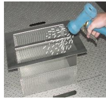
Reinigen Sie den Waschtanksieb.