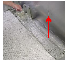
Entfernen Sie die seitlichen Siebkörbe.