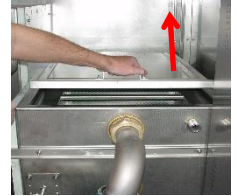
Entfernen Sie die Abdeckung am Waschtank.