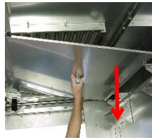
Entnehmen Sie den Dachhimmel.