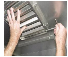
Entfernen Sie den Kondensatabscheider.