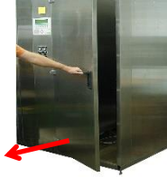
Öffnen Sie den Installationsraum.