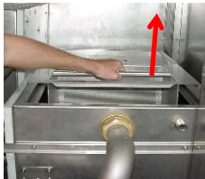
Entnehmen Sie den Waschtanksieb.