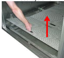
Entfernen Sie die Trittbleche aus der Washkammer.