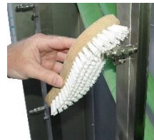
Reinigen Sie die kompletten Düsen mit einer Nylonbürste.