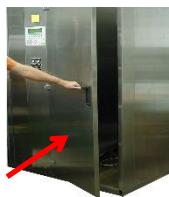
Schließen Sie den Installationsraum.