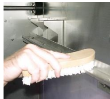
Reinigen Sie die Laufschiene des Waschsystems.