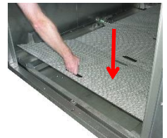
Setzen Sie die Trittbleche wieder ein.