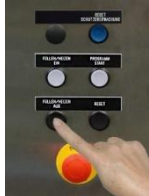
Schalten Sie die Maschine aus.