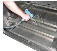
Reinigen Sie den Washkammerinnenraum mit einem Wasserschlauch.