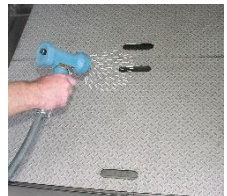
Reinigen Sie die Trittbleche mit einem Wasserschlauch.