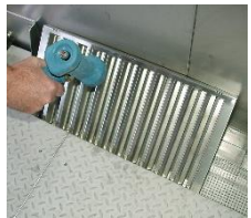
Reinigen Sie den Kondensatabscheider.