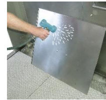
Reinigen Sie den Dachhimmel.