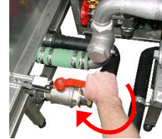
Öffnen Sie das Ablasventil der Waschwanne.