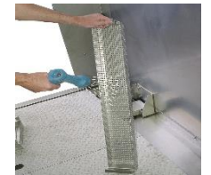
Reinigen Sie die seitlichen Siebkörbe.