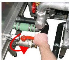
Nachdem Sie die Teile eingesetzt haben, schließen sie nun die geöffneten Ablasventile.

Nachdem Sie die Maschine gereinigt haben, bauen Sie alle Teile wieder ein, und prüfen Sie die Vollständigkeit und richtige Position.